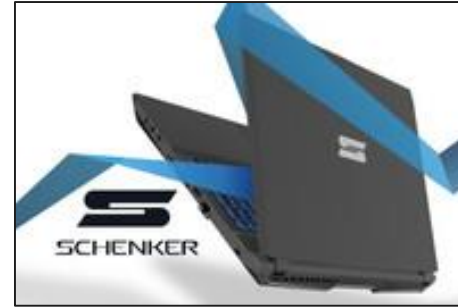
Schenker Technologies GmbH - Geheimtipp in der Gaming Szene.