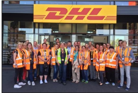
DHL HUB Leipzig bei Nacht erleben.