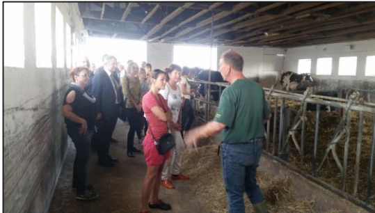
Der Bauer und das liebe Vieh. Agrarprodukte Kitzen e.G.