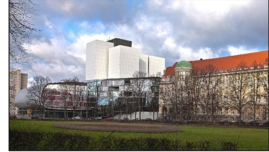
Deutsche Nationalbibliothek Leipzig. Lesen. Hören. Wissen.