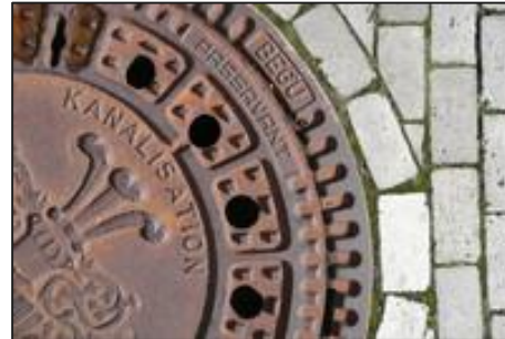
Leipzig von unten. Kanaleinstieg und Gesprächsrunde: Ausbildung in der L-Gruppe